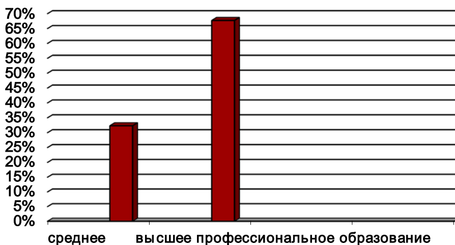
Образовательный уровень в процентном соотношении

Наблюдается повышение показателей качественного состава педагогического коллектива. Количество педагогов с квалификационной категорией: высшая - 24 педагога (77,4%), первая - 3 педагога (9,6%). Количество педагогов, не имеющих категорию: 4 педагога (12,9 %).